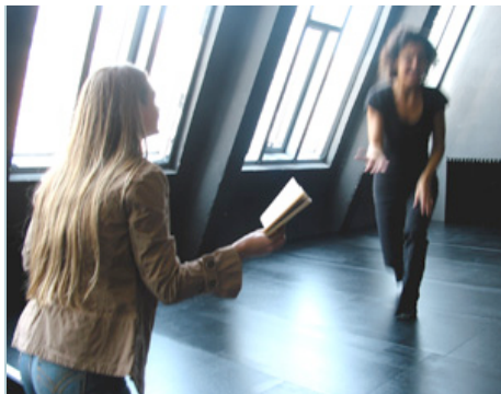
Die Geschäftsführerin hat nach der Übernahme vieles verändert - unter anderem wurde der Unterricht von Nachmittags- auf Ganztagsbetrieb umgestellt.