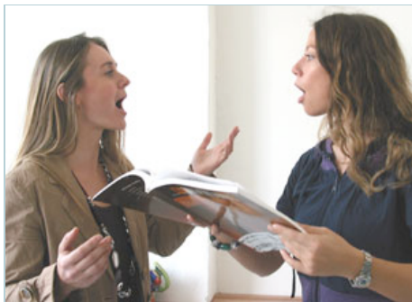
Neben dem Erlernen des "klassischen Handwerks" sollen sich die SchülerInnen in vielen schauspielerischen Bereichen ausprobieren können.